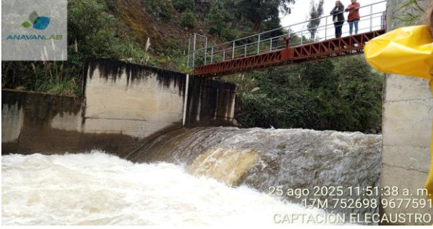
Fotografía 1. Vista General