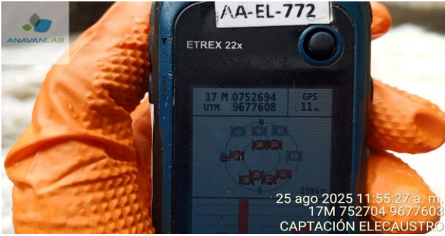
Fotografía 3. Coordenadas Geográficas