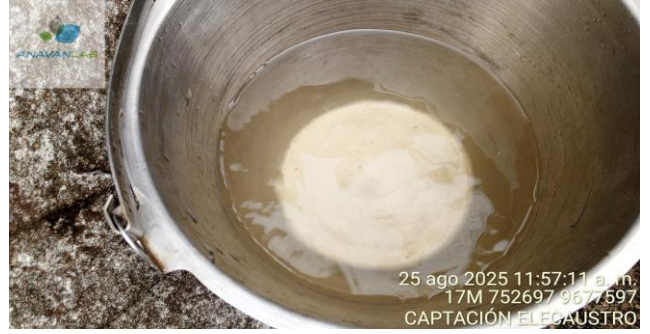
Fotografía 2. Apariencia de la muestra