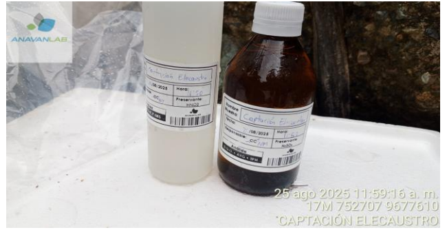
Fotografía 4. Muestra