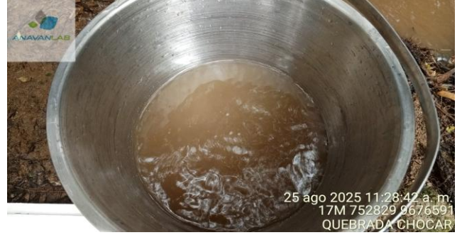
Fotografía 2. Apariencia de la muestra