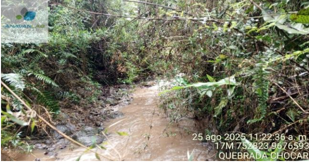
Fotografía 1. Vista General