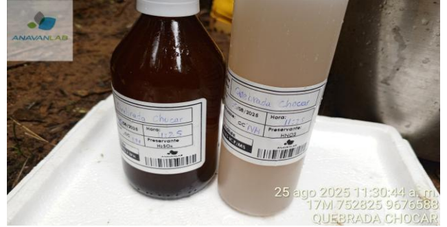
Fotografía 4. Muestra