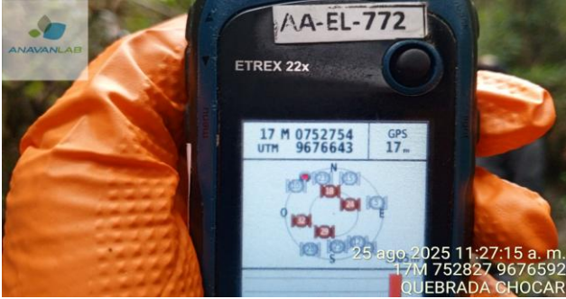
Fotografía 3. Coordenadas Geográficas