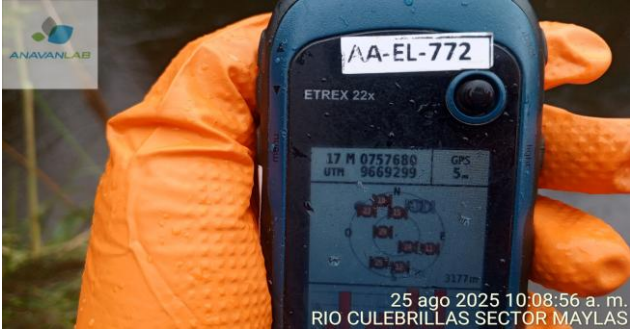
Fotografía 3. Coordenadas Geográficas