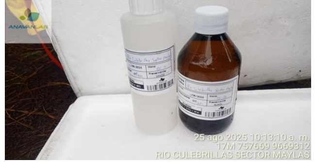
Fotografía 4. Muestra