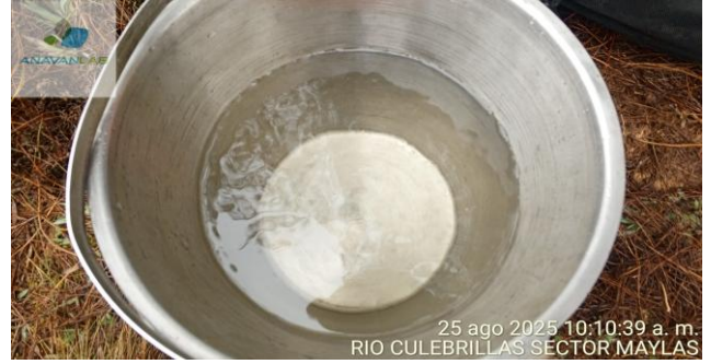
Fotografía 2. Apariencia de la muestra