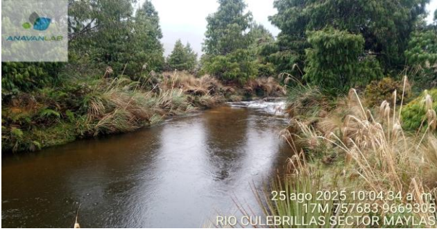
Fotografía 1. Vista General